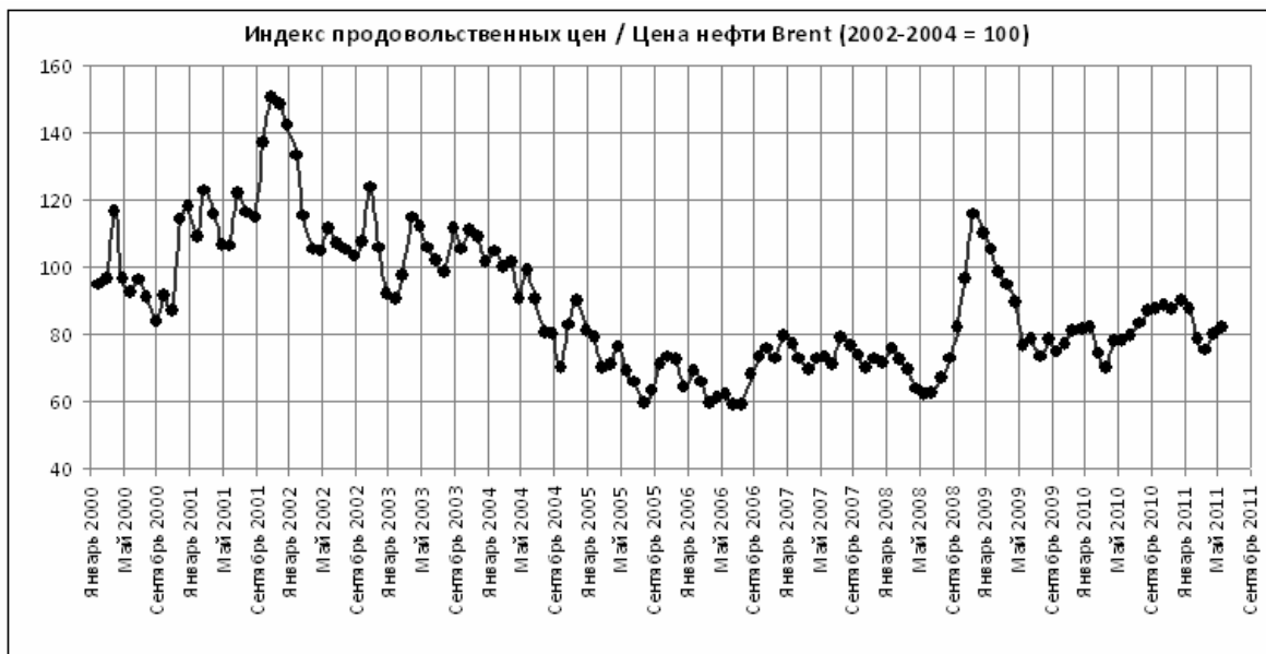
Рис. 3. – Рост продовольственных цен (с учетом инфляции) в годы мирового кризиса и временной ряд изменений отношения продовольственных и нефтяных цен

Разумеется, не все арабские страны живут сугубо на нефтяные доходы. С одной стороны, в определенной степени эти графики проясняют, почему основные революционные события произошли в Тунисе, где нет нефти, в Египте и Сирии, где добыча нефти и газа (по сравнению с главными экспортерами нефти) невелика относительно большой численности населения, а также в Йемене, где добыча нефти падает. С другой стороны, даже при государственном дотировании продовольст-