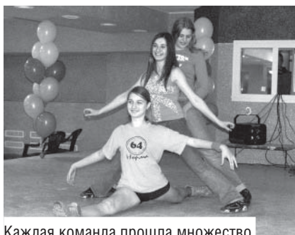
Каждая команда прошла множество «испытаний» на пути к победе

После всех увеселительных мероприятий объявили результаты: первое место заняла «десятка», второе — «семерка», третье — «пятерка». Призы, если честно, поразили своим количеством и своим разнообразием. Получить за участие в мероприятии можно было все: ящик Кока-Колы, цифровые сертификаты от компании «N-Foto», абонементы в клуб «Пятый элемент», билеты на любой сеанс в сеть кинотеатров «Арт-Сайнс Синема», фирменные футболки НГУ, абонементы в студию загара «Saint-Tropez», наконец, торт от компании «Русич». Праздник также поддерживали «Сибирская канцелярская компания» и компания «Полиграфика», студенческая столовая НГУ, администрация университета, ОКЦ, профком студентов, спортклуб НГУ, студсоветы общежитий и дирекция студгородка. Информационные услуги предоставили «Вечерний Новосибирск», «Бумеранг», «Навигатор» и «Студенческий город». За что всем нашим партнерам огромное и человеческое «спасибо!» Без них праздник бы не получился таким шикарным.