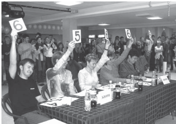
Компетентное жюри по достоинству оценивало таланты команд

Итак, холодного 21 октября новый клуб, пока еще довольно пустой и непривычный, раскрыв свои двери для радостных первокурсников и всех желающих студентов.