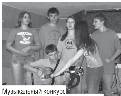
Музыкальный конкурс запомнился зрителям больше всего

Из всех конкурсов публика особо запомнила два: написание письма студентом из общежития и музыкальный конкурс. Первый глубоко запал в память не тем, что смешной, хотя и поэтому тоже, а тем, что почти все писали мамам о том, как сложно живется студенту. Все житейские нурядицы гипербо-