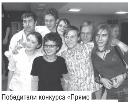
Победители конкурса «Прямо по курсу» — команда общежития № 10

Впереди еще немалая череда праздников, посвящений, медиан и всего прочего, так что мы здесь — надолго! □