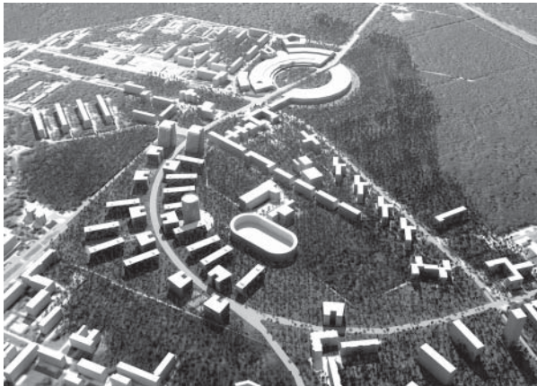
Возможно, именно так будет выглядеть комплекс зданий Технопарка с высоты птичьего полета

В ближайшие несколько лет ожидается новый этап развития НГУ и Академгородка. Надежды на изменения в лучшую сторону связывают, прежде всего, со строительством Технопарка и главного корпуса НГУ