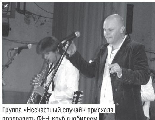
Группа «Несчастный случай» приехала поздравить ФЕН-клуб с юбилеем

ФЕН-клуб отметил свой 45-летний юбилей. Три дня на территории студгородка и в ДМ «Юность» проходили мероприятия, посвященные этому событию. В рамках фестиваля были проведены капустники, конференции, концерты столичных гостей, спортивные турниры и развлекательные игры. □