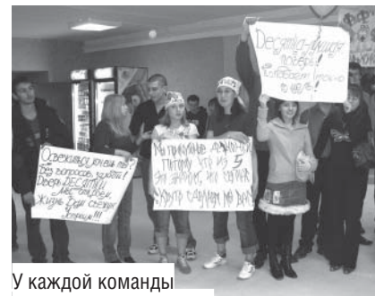
У каждой команды были свои болельщики

Музыкальное состязание рассмешило абсолютно всех. Смысл его был в том, чтобы громко подпевать песне, которая играет в наушниках. Остальные ее не слышат. В результате мы наблюдали комичную картину «как в маршрутке»: кто-то слушает музыку и держится за уши, пытается подпевать, но голос оставляет желать лучшего, потому что сам певец его не слышит. «Крошка моя» в женском исполнении была только цветочками, после чего в ход пошла тяжелая артиллерия: «Нас не догонят» оперным мужским голосом, «www. Ленинград» женским басом и многое другое.