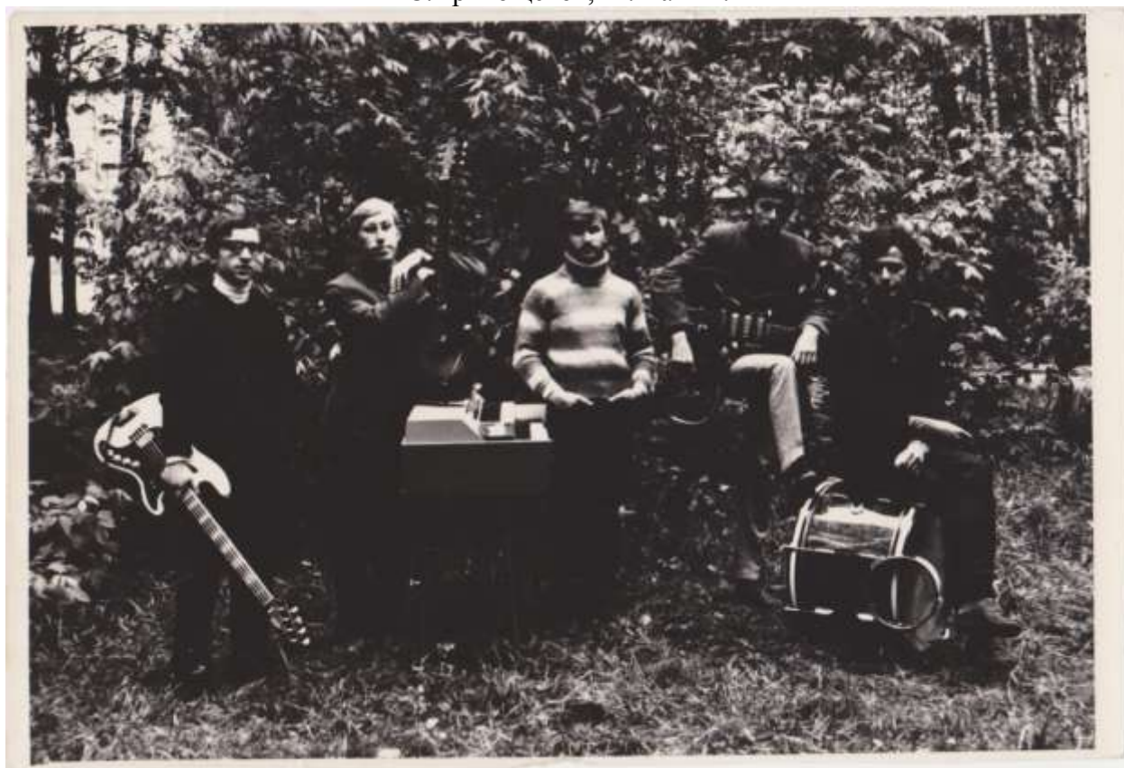
The Black Lines Lines – лауреаты фестиваля «Джаз-69».