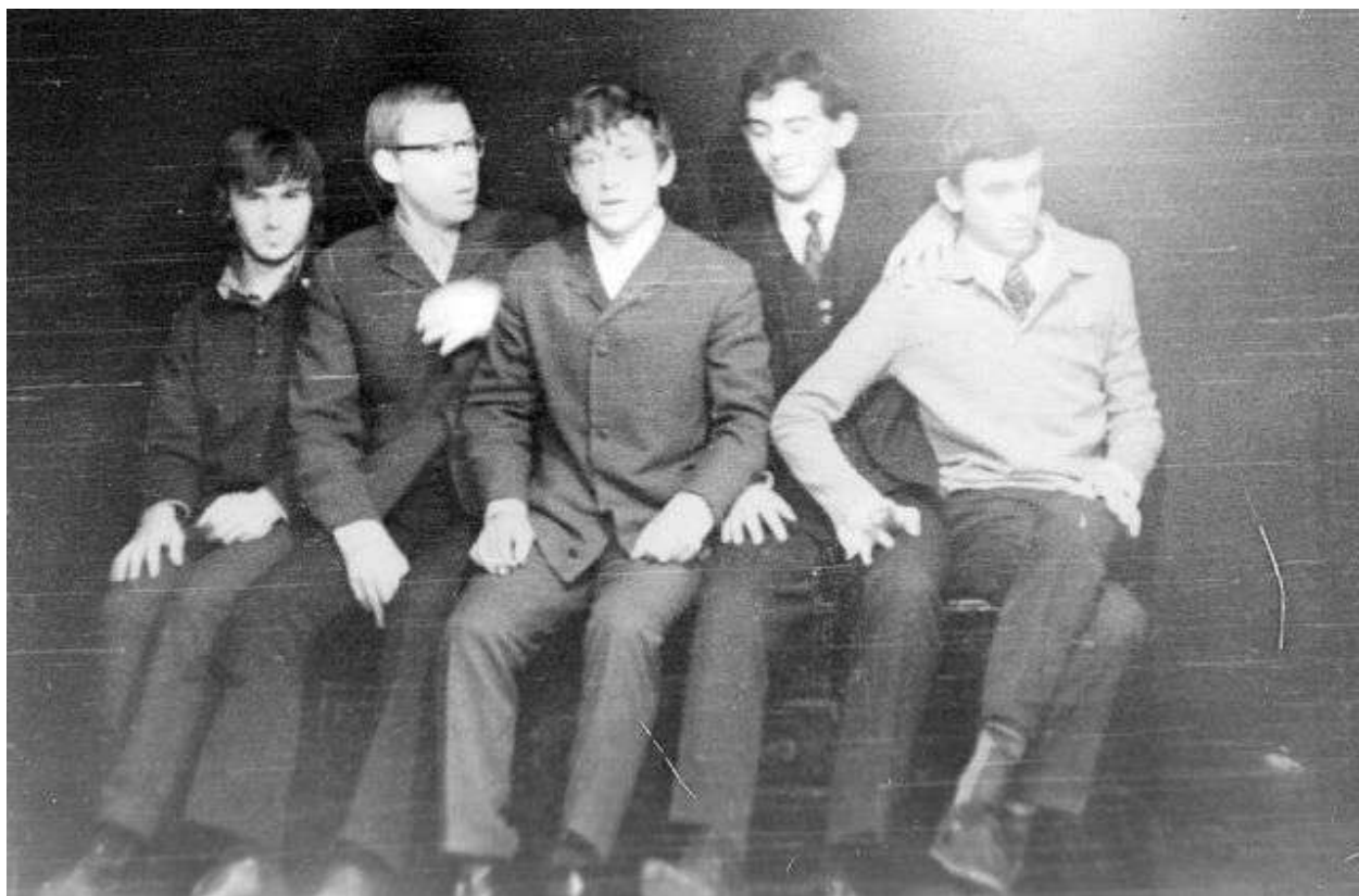
The Black Lines. ДК «Юность». 1968 год.