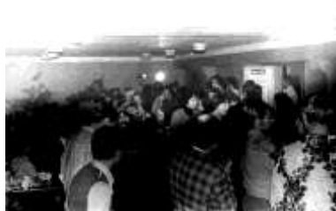
The Dawdles. Холл 5-го общежития. 1967 г.