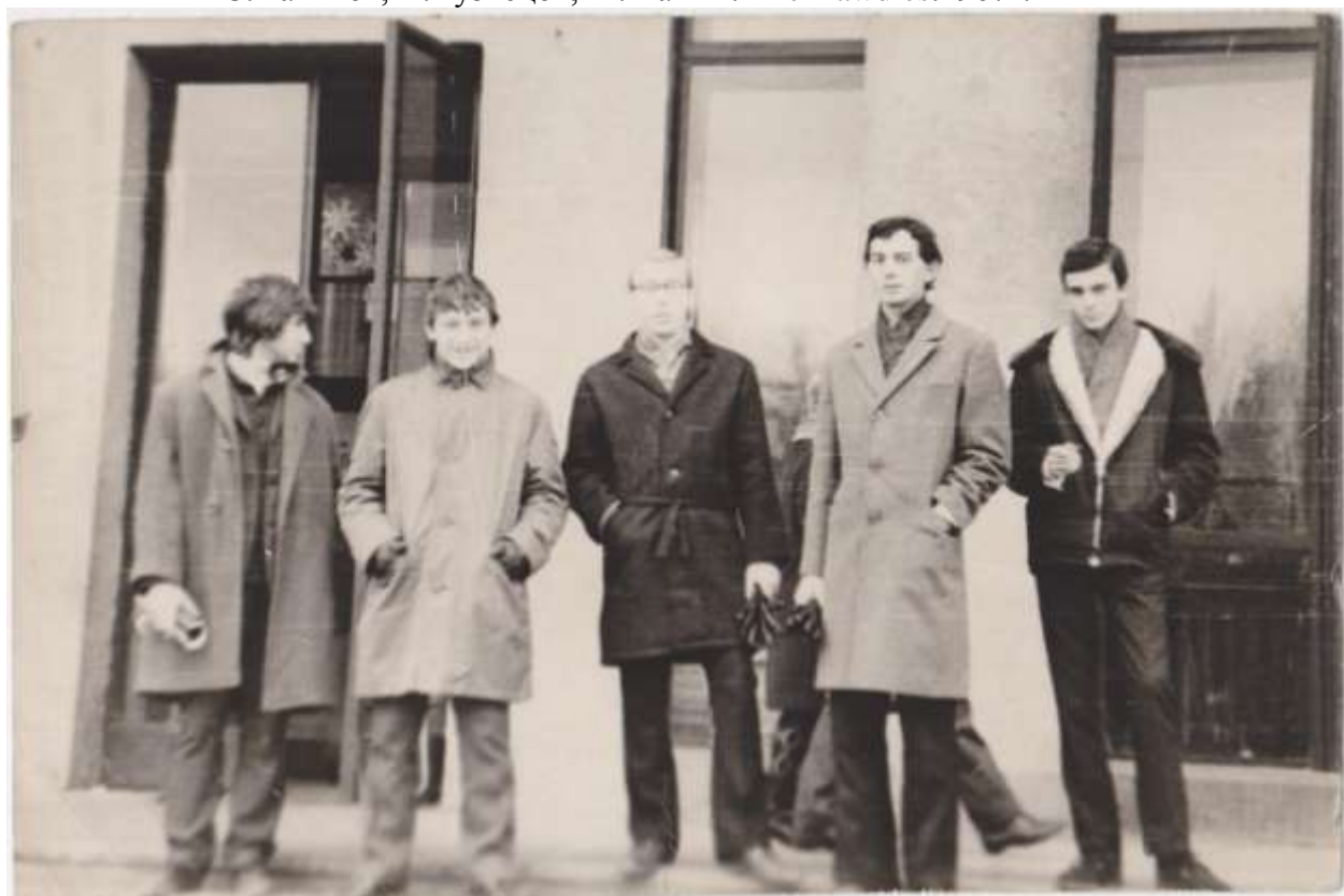
The Black Lines. ДК «Юность». 1968 год.