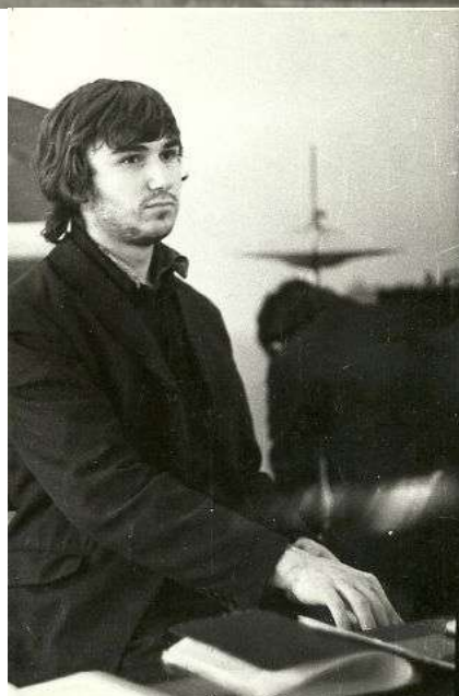
The Black Lines. ДК «Юность». 1968 год.