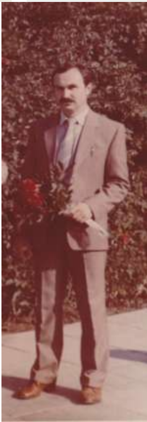
М.Мамин. Крым. Партенит. 1996 год