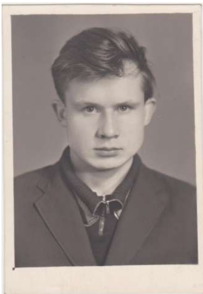
Гена Храмов. 1967 год.