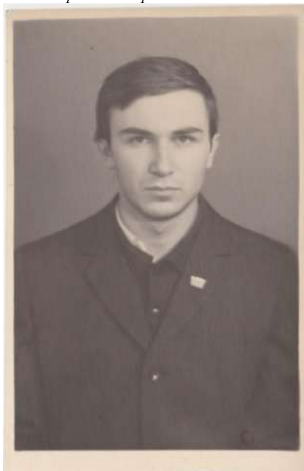
Михаил Мамин. 1963 год.