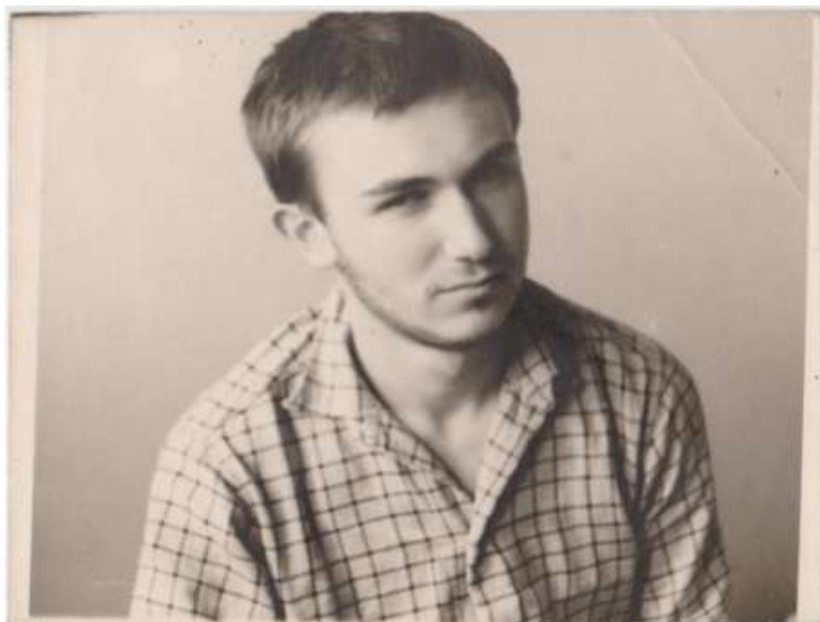
Михаил Мамин. 1966 год.