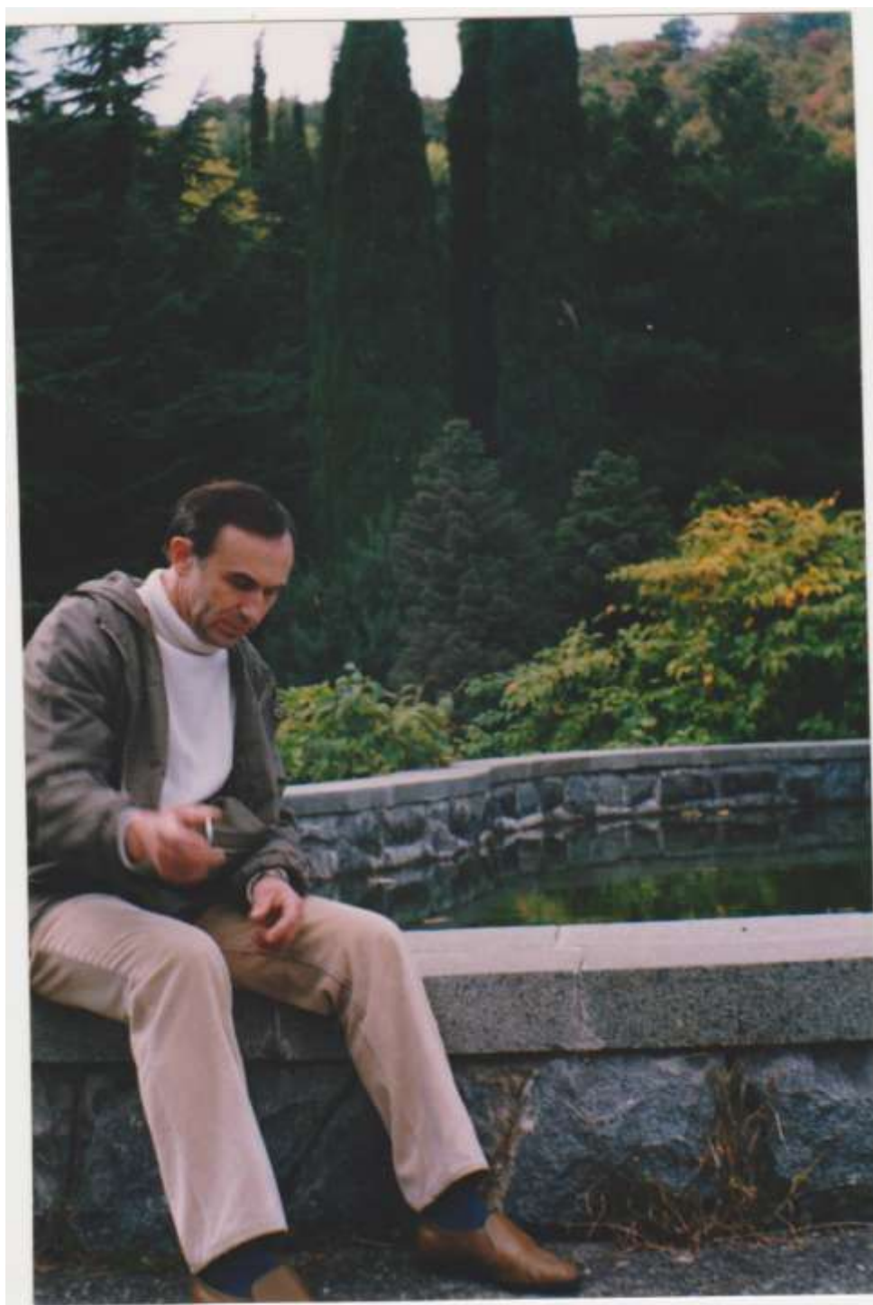
М.Мамин. Крым. Паргенит. 1998 г.